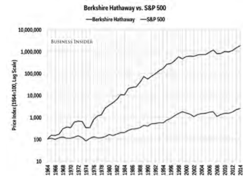
1. ábra: A Berkshire Hathaway vs. S&P 500 1964–2016-ig.

Ha ez a szóban forgó „valaki” 50 évvel ezelőtt, Warren Buffett cégébe, a Berkshire Hathaway-be fektetett volna 500 dollárt, akkor átlagosan 20,8% hozamot ért volna el. Azaz 500 dollárból 6,3 millió dollár lenne, azaz 1,9 milliárd forint (igen, jól olvasol, nem millió, hanem milliárd).