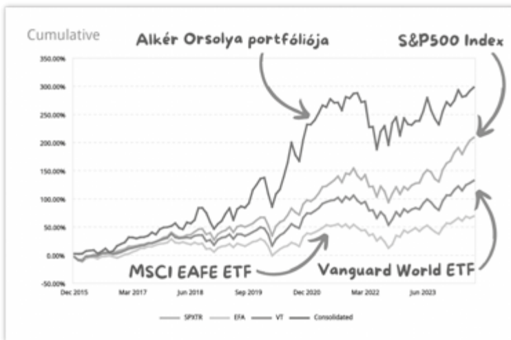
14. ábra: A felső vonal jelzi a szerző befektetési hozamának alakulását. Az alsó három vonal a piaci teljesítmény görbék, köztük az S&P500. Az ábrából látható, hogy a szerző fókuszált értékalapú befektetési portfóliója jóval a piaci átlag felett teljesített. Ilyen eredményt csak fókuszált értékalapú portfólióval lehet elérni.