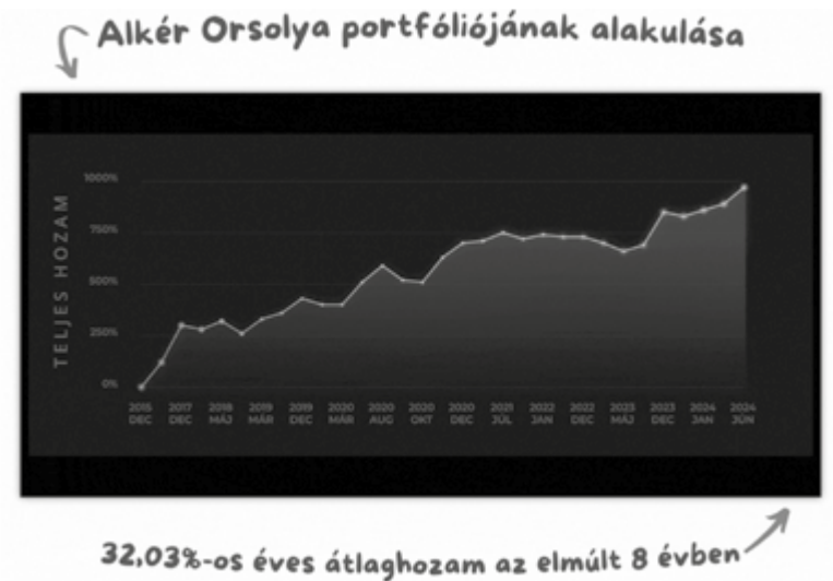
13. ábra: A szerző portfóliójának hozama 2016-2024 között átlagban évi 32,03% volt, ami kimagasló hozamnak számít.